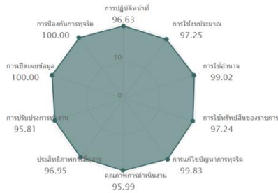
คะแนนสูงสุดรายตัวชี้วัด